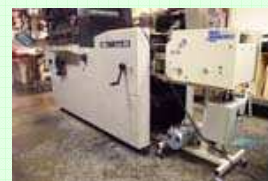
C9000 installato su Toko R2